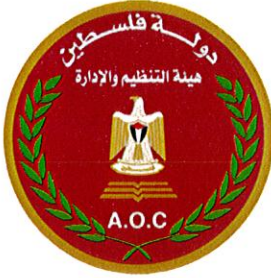
هيئة التنظيم والإدارة